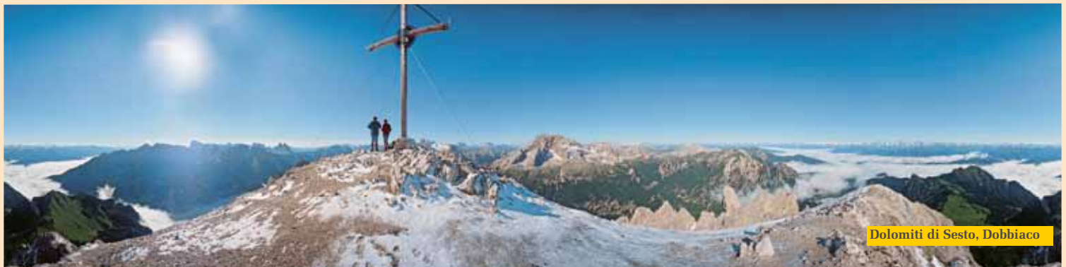
Dolomiti di Sesto, Dobbiaco

Ogni lunedì, martedì, mercoledì e giovedì, dalle ore 9.30 alle 17.00 “il pranzo è servito” per i bambini d'età superiore a 3 anni