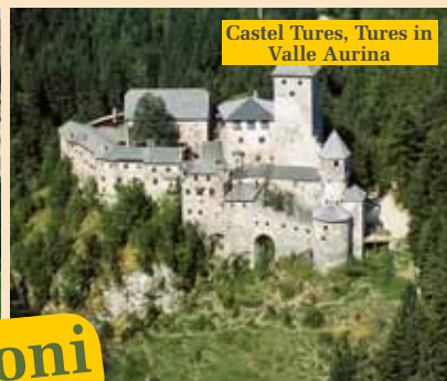
Castel Tures, Tures in Valle Aurina