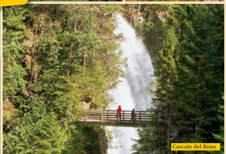
Cascate del Reno