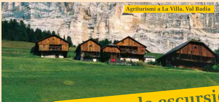
Agriturismi a La Villa, Val Badia