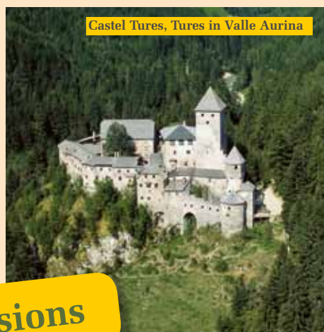
Castel Tures, Tures in Valle Aurina