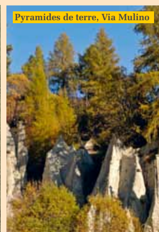
Pyramides de terre, Via Mulino