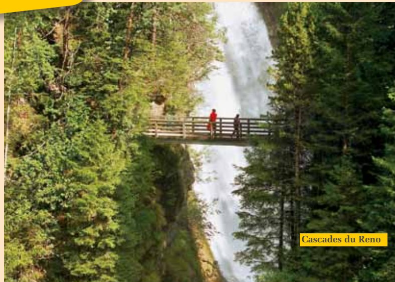
Cascades du Reno