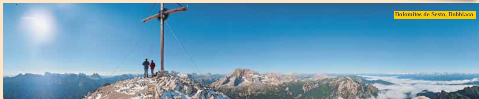
Dolomites de Sesto, Dobbiaco

De mi-juin à début septembre 2012 de programme gratuit pour les enfants tous les lundi, mardi, mercredi et jeudi, de 9.30 à 17.00 horloge besoin déjeuner y compris pour les enfants de 3 ans