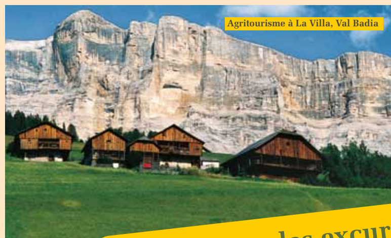
Agritourisme à La Villa, Val Badia